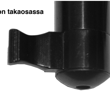
1407 -1813 -mallien etutunnelin lohenpyrstö