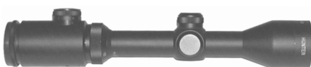
HUNTER 1,5 - 6 x 40