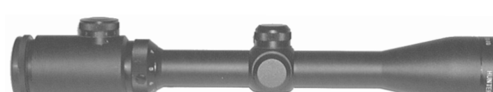
HUNTER 3 - 9 x 40