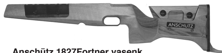
Anschütz 1827Fortner vasenk. AH-tukki , kuvassa oleva 170,-