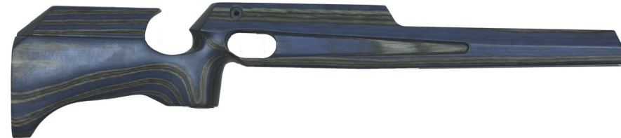
UUSI HAMMERLI AR50 TUKKI: Vasenkätinen puulaminaattitukki sin./harm.puuosat 150,-