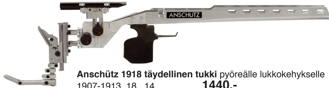
Anschütz 1918 täydellinen tukki pyöreälle lukkokehykselle 1907-1913, 18.. 14.. 1440,- Anschütz 2018 täydellinen tukki kulmikkaalle lukkokehykselle 2007 -2013 1440,-