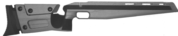
Anschütz 2007 vakiokiväärin pyökki (myös. 300m) 250,-