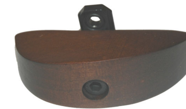
Kämmesyrrjäntuki Anschütz puutukkiin täyd. 20,- pelkkä puuosa 7,-