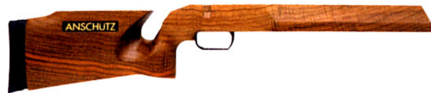
Anschütz BR50-1 ja -2 kasa-ammuntatukit 450,- pyöreälle lukkokehykselle kiinn. 2-ruuvilla ja kulmikkaalle lukkokehykselle kiinn. 4-ruuvilla