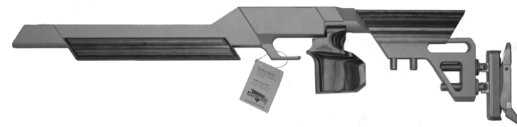
Anschütz 2002 (ilmakivääri) alutukki 350,- alumiiniväri + kirjava puulaminaatti