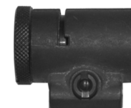
Anschütz 6523 etutunneliin löytyy edelleenkin kiinnitysosat Koukkuruuvi 4,- Mutteri edelliseen 2,-

Jos tunnelissa on vikaa se kannattaa korvata ahg Strong tunnelilla hinta 74,-