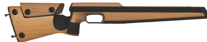
Anschütz 2001 ilmakiväärin tukki, pyökki , ilman perälaitetta, muutoin täydellinen 150,-