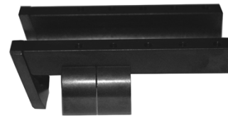
Anschütz 2013-U80 lisäpaino puutukin etupäähän, runko-osa 30,- Alutukin painot 2013-U82 75g / kpl 15,50