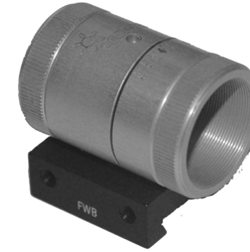
Centra matala kallisteltava etutunneli 40,- Ø18mm, sisäiset viikset, kätevä kallistuksen säätö, eri värejä, ei jyvän kiinnitysruuvia FWB ja Hämmerli kiskoon